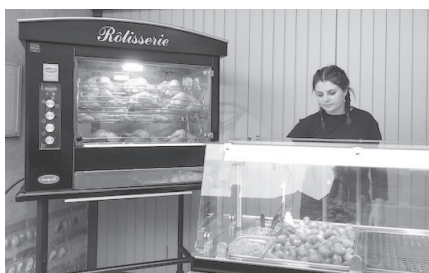
Nouveau service proposé par la Manufacture des Pains, vente de poulets rôtis le dimanche matin au 50 Rue Gombette